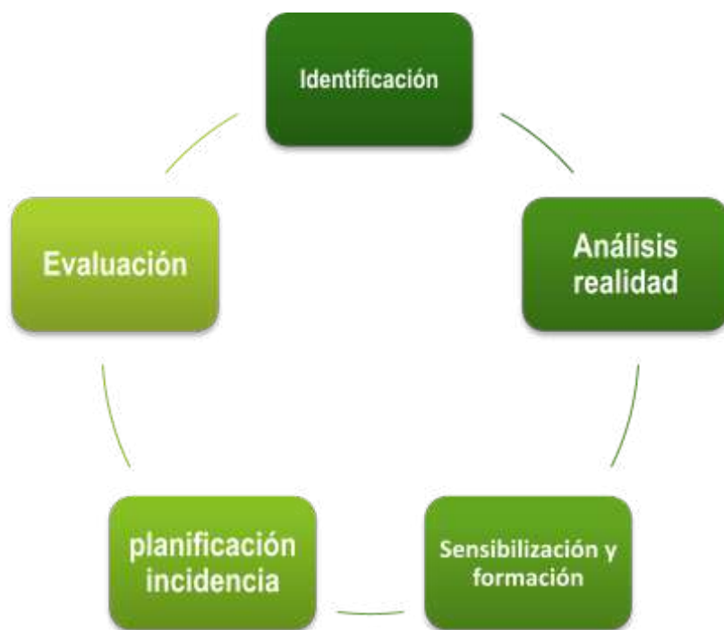
Gráfico 1: Procesos estratégicos