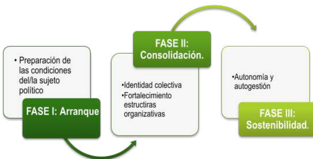
Tabla 1: Fases de la intervención

Se establecen por parte de principalmente los titulares de derechos (TTDD), con el acompañamiento de los titulares de responsabilidades (TTRR), las acciones necesarias a nivel de incidencia que permitan la incorporación de sus propuestas en las políticas públicas para lograr las transformaciones deseadas. Se pretende llegar a un momento de autonomía y autogestión de las estructuras organizativas y de participación activa en el territorio.