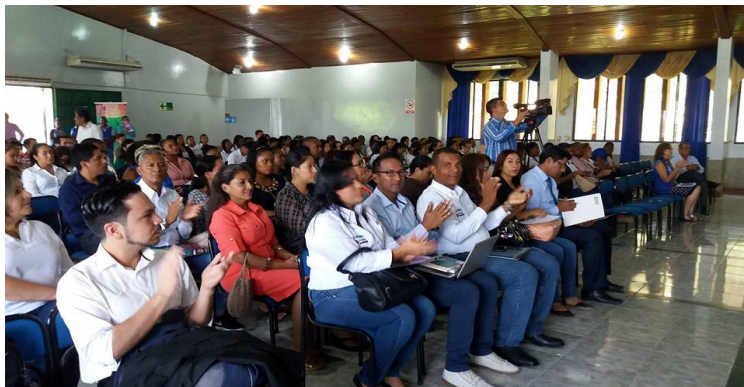
Imagen 1 Participantes en el foro