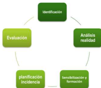
Gráfico 1: Procesos estratégicos