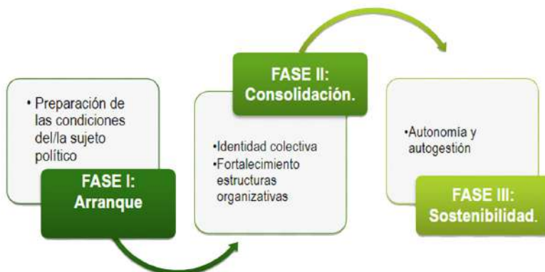
Tabla 1: Fases de la intervención